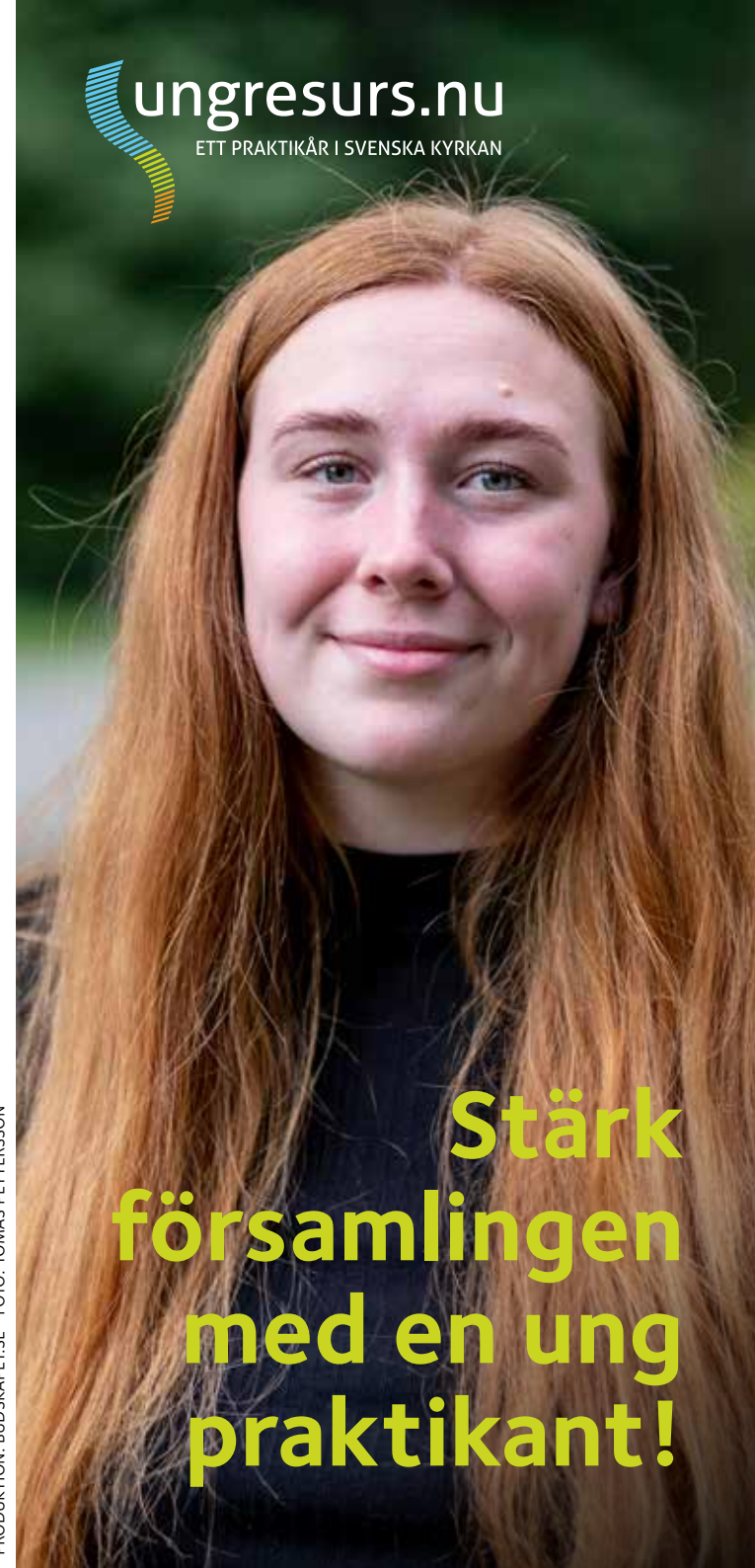
PRODUKTION: BUDSKAPET.SE

Stärk församlingen med en ung praktikant!